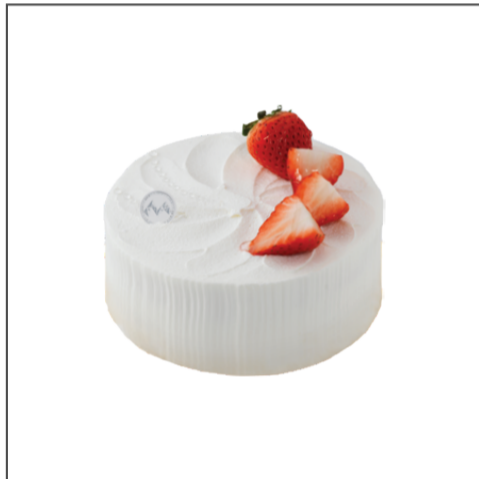
가토 아라 크림 후레즈 73,000원