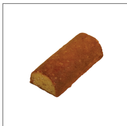
케익 오란쥬 32,000원