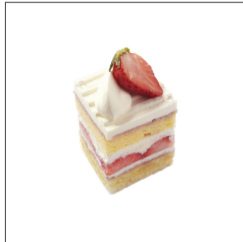
세종드 가토 후레즈 15,000원

폭신한 스펀지 시트 사이에 생크림과 새콤달콤한 딸기를 샌드한 쇼트 케이크