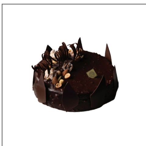
애니버서 쇼콜라 70,000원