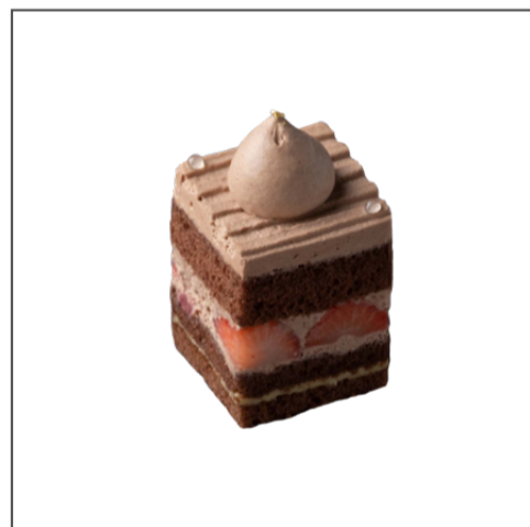
세종드 가토 쇼콜라 15,500원