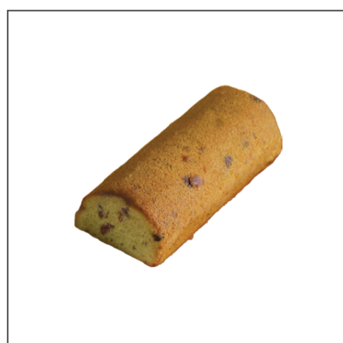
케익 피스타슈 34,000원