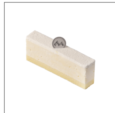
프로마쥬 크류 13,000원