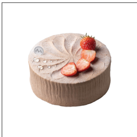
가토 아라 크림 쇼콜라 74,000원