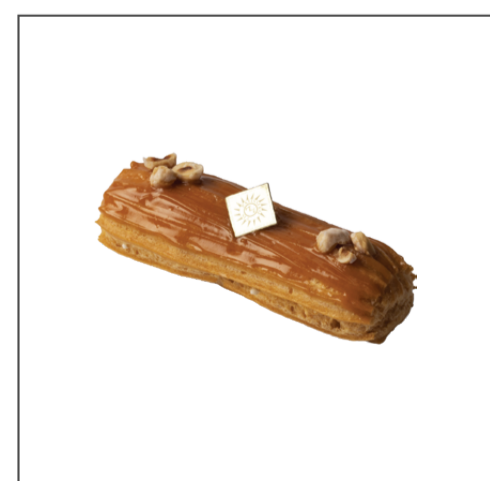
솔티드 카라멜 에클레르 8,000원